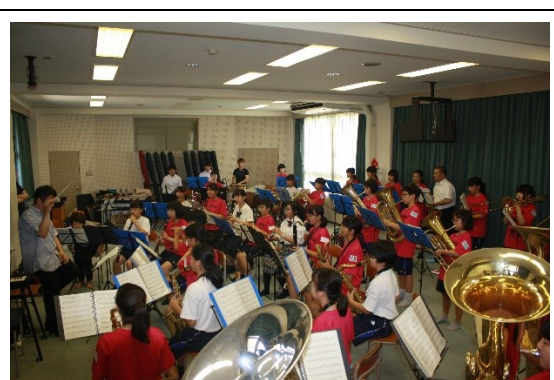
( 合同演奏の様子 )