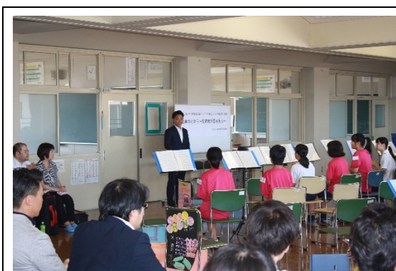
( 里中理事長挨拶 )

参加された方々に調和や協調性の大切さを実感していただいた結果だと認識しております。今回の経験を活かし、今後の生活においても調和と協調性を持って行動していただければと思います。