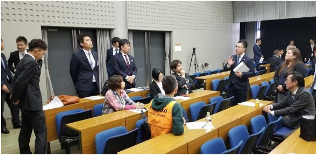
情報交換タイムにて市民議会での感想を話しあう 参加者や四日市青年会議所メンバーたち