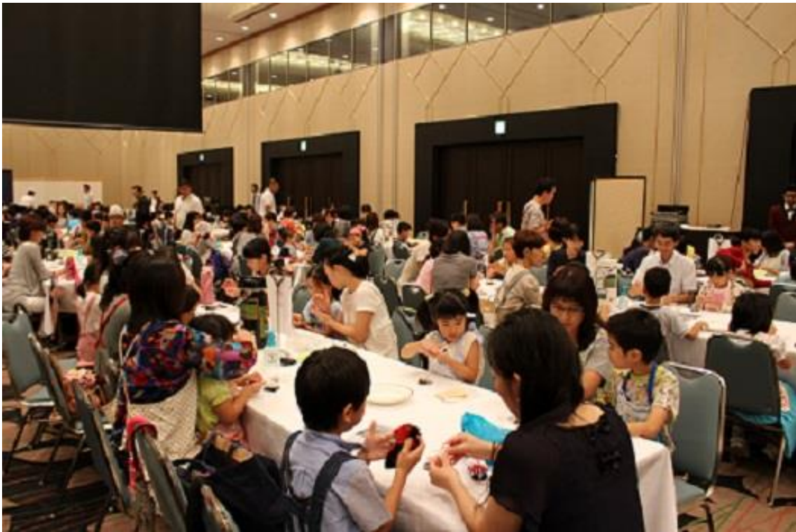
子どもたちが自ら手を動かし和菓子を作りました