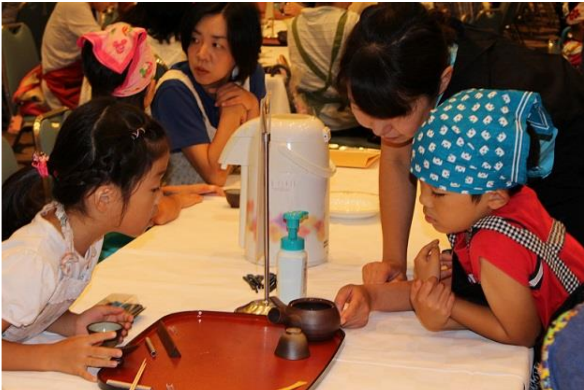
お茶の葉が開いている様子を観察する子どもたち